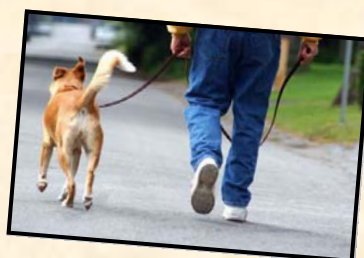
تا می توانید راه بروید