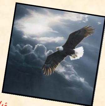
آوازی از عقاب در رؤیا