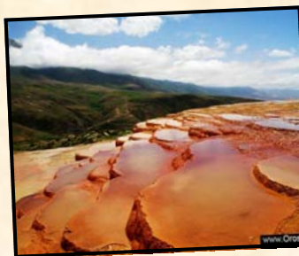
پشمه های باداب سورت