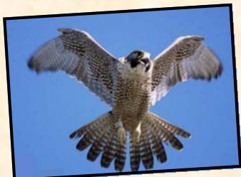
ترین های دنیای پرنندگان