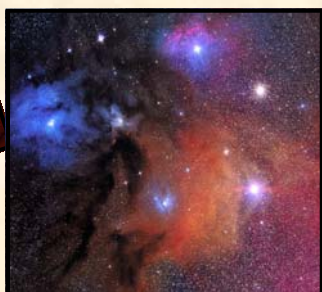
چرا جهان وجود دارد؟