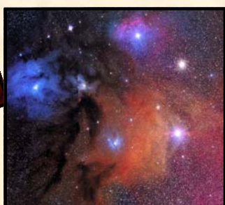
چرا جهان وجود دارد؟